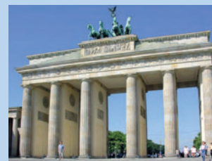
Berlin ca. 60km