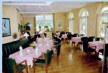
Gourmet Restaurant „Fischhaus“ ca. 2km