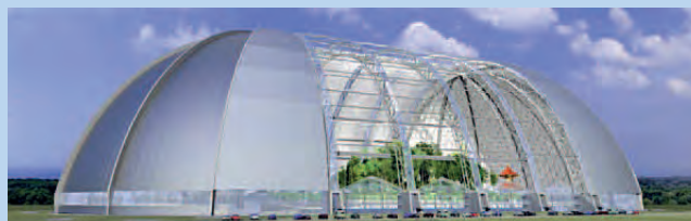
Tropical Islands ca. 40km