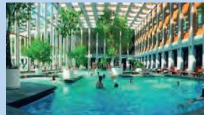
Bad Saarow Therme ca. 12km