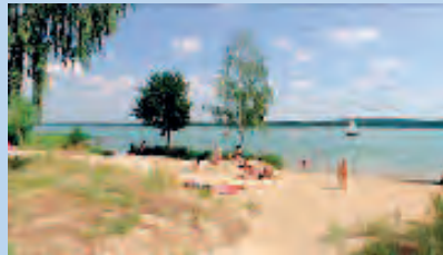
Strand am Scharmützelsee ca. 150m