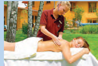
SATAMA Saunapark ca. 150m